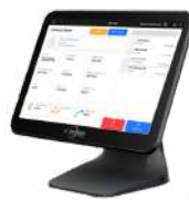
E - JETON R13