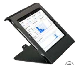
SUPORTE PARA TABLET IPAD - 360°