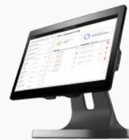
SUNMI T2 LITE