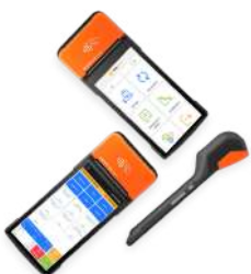
SUNMI V2 PRO