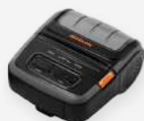
BIXOLON SPP - R310